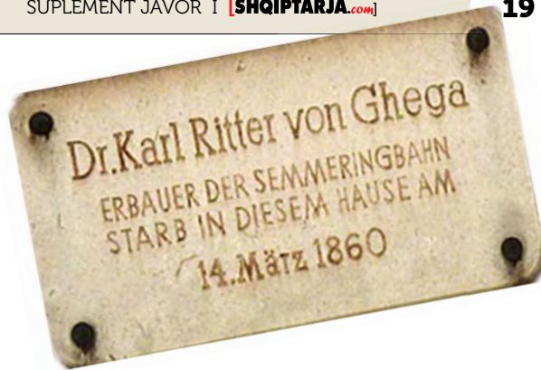
► Pllakë perkujtimore në dritaren ku ka jetuar Karl Ghëga, në pallatin Sina