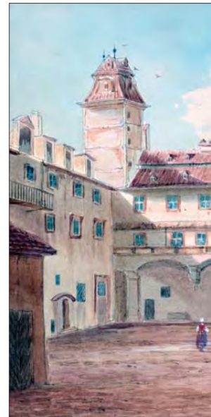
► Felderhof 1 para rindërtimit nga Sina