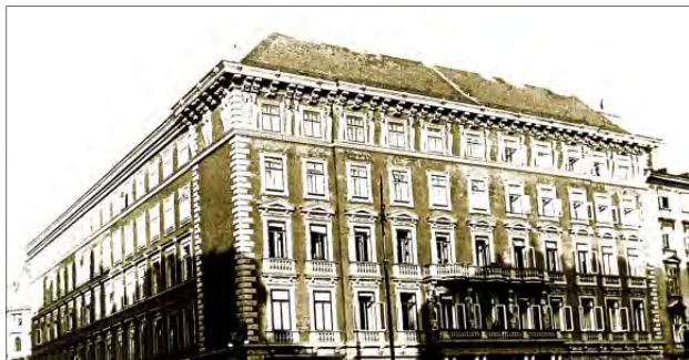
► Pallati Sina ne Hoher Markt 8