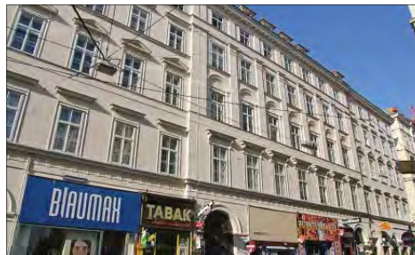
► Pallati i Sina-s ne Fleischmarkt 20, Kafe – Restaurant