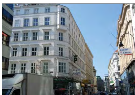
► Pallati i Sina-s ne Lugeck 7